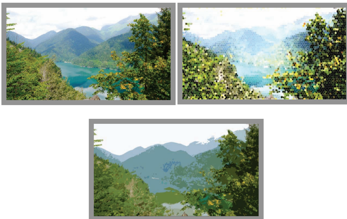
Рисунок 4 – применение фильтров зернения и аппликации к фотоснимку пейзажного мотива.

изображения на мелкие части, а наоборот, на обобщение основных цветотональных отношений (Рисунок 4).