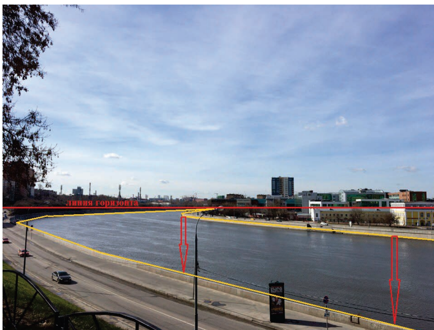
Рисунок 1 – Пример использования графического приложения мобильного устройства при объяснении учебного материала в условиях пленэра

На рисунке 1 показан пример использования простейшей векторной графики на фотоснимке для наглядности действия закономерностей линейной перспективы на пленэре в городе. Таким же образом можно анализировать пропорциональные соотношения различных окружающих предметов, находясь в условиях пленэра.