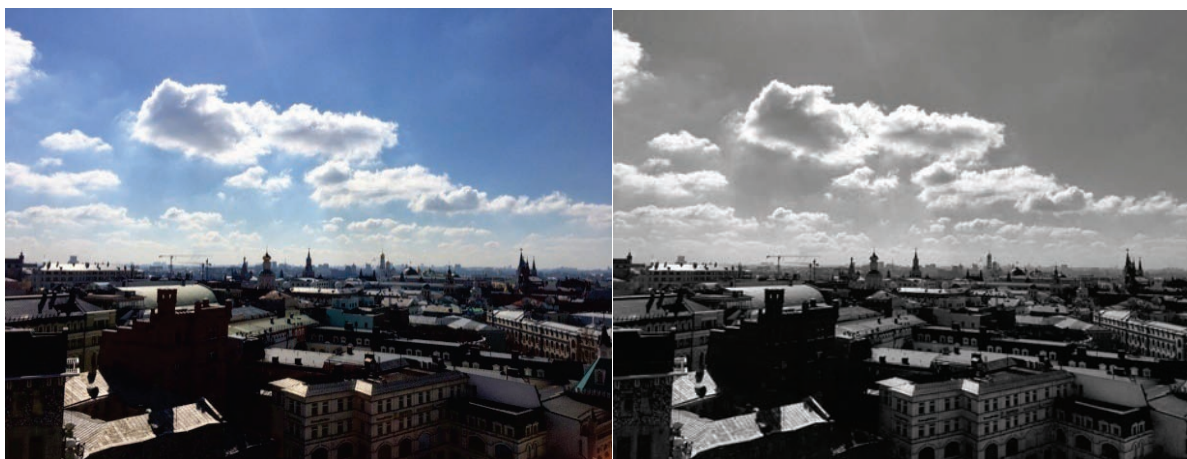
Рисунок 2 – Пример обесцвечивания фотокадра для определения основных тоновых отношений сложного мотива в условиях пленэра

Пример обесцвечивания фотокадра показан на рисунке 2. Делая изображение монохромным, начинающему художнику легче определиться с тоновыми отношениями в сложном мотиве.