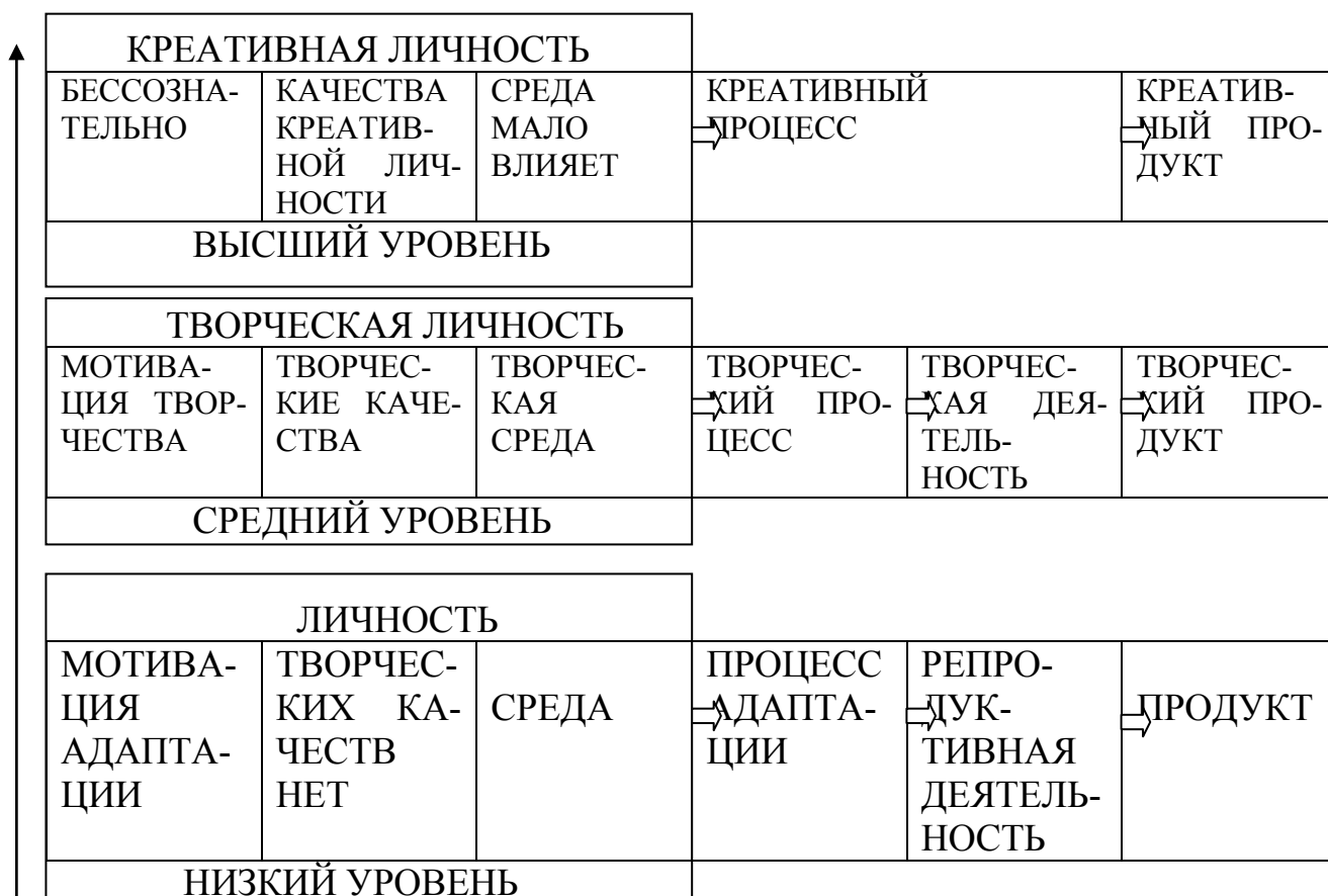
Рис. № 2. Уровни креативности.

Данная модель, с учетом мотивации и роли среды, позволяет выделить уровни проявления креативности (рис. № 2) от минимального (креативность близка 0) до максимального (на уровне творческой гениальности).