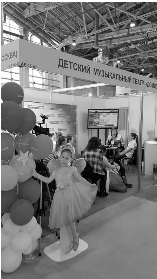
Детский музыкальный театр "Домисолька на ММСО-2017"