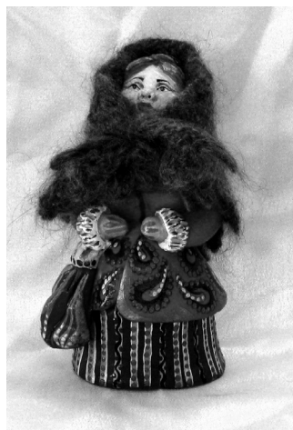
Рис. 2. Игрушка «Борисоглебская купчиха»