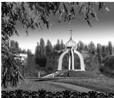
Рис.3.1. Мемориала памяти жителям Борисоглебска. Часовня