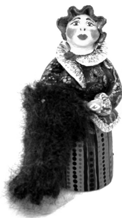
Рис. 1. Игрушка «Борисоглебская торговка»

В январе 2012 года в нашем городе впервые проводился открытый конкурс на изготовление лучших эскизов и образцов сувенирной продукции Борисоглебского городского округа [3]. На конкурс мною были представлены глиняные игрушки «Борисоглебская купчиха» (рис.1), «Борисоглебская торговка» (рис.2) и пуховый платок (рис. 3.) с изображением мемориала памяти жителям Борисоглебска. Часовня (рис.3.1.).